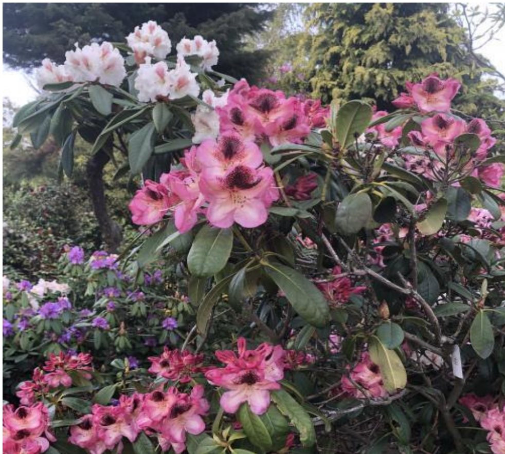
Fra haven i Gedser