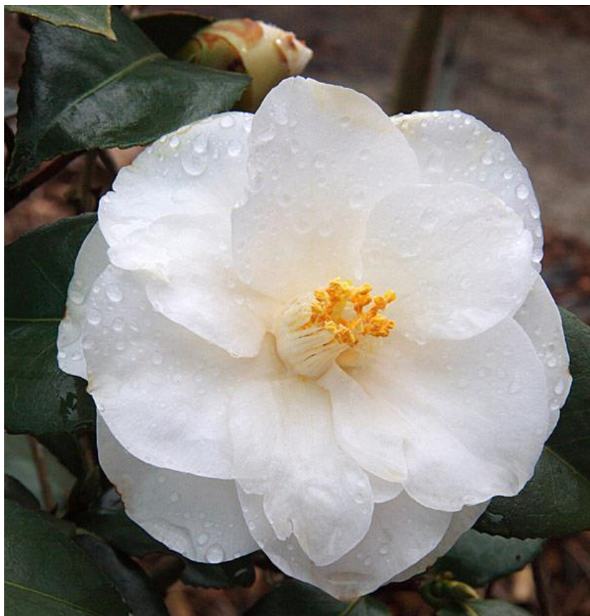
Kamelia Dronning Ingrid