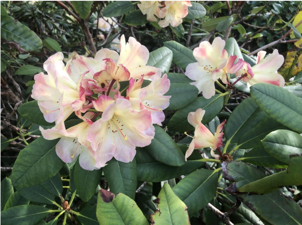
Billeder fra haven i Lodsstræde